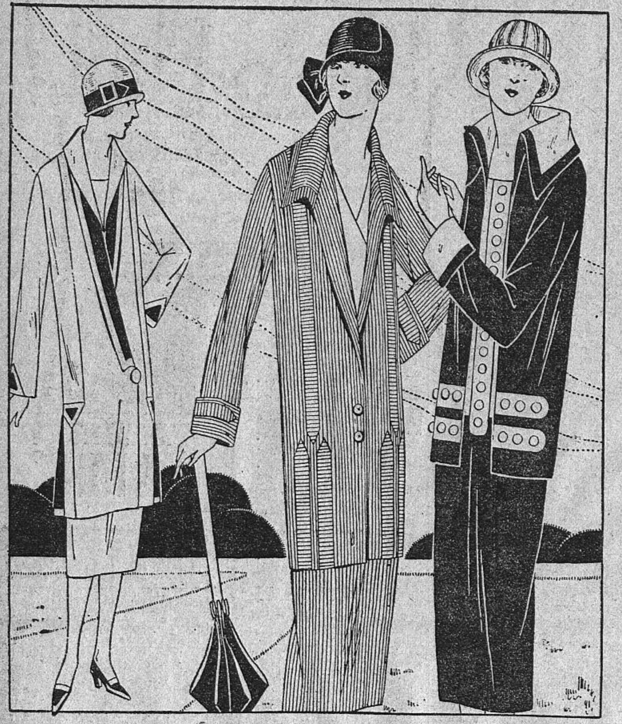
Costume de hashatou beige garni de kasha rose vif. Costume en lainage à côtes gris souris. Costume en laine lisse marine éclairé d'un sergé de soie blanc.

Il est habituel de subir avant l'avènement de la tiédeur printannière un retour offensif du froid. On apprécie donc encore le confort du manteau de fourrure, tout en s'occupant activement de préparer les nouvelles toilettes afin de n'être pas en retard quand le soleil reparaitra.